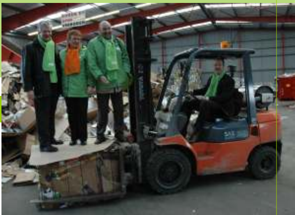
Op campagne in Harlingen.

Het CDA Fryslân is bij de Provinciale Statenverkiezingen op 7 maart 2007 als grootste partij uit de bus gerold. Het CDA heeft in totaal meer dan 68000 stemmen gekregen, goed voor 12 zetels. Dat is ruim 300 stemmen meer als de tweede partij