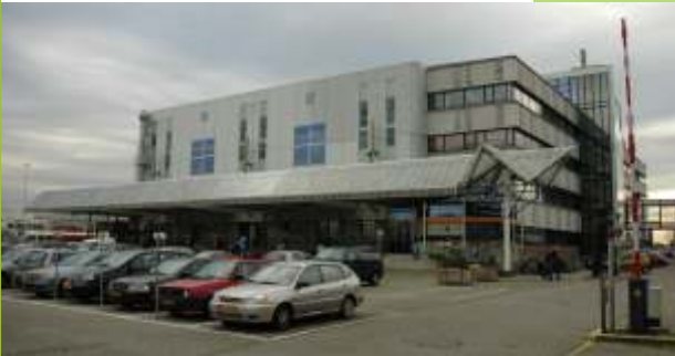
Het tijdelijke Provinciehuis aan de Snekerweg in Leeuwarden.

Begjin 2007 sit Minister ter Horst yn noed oer de regionale rampebestriding en krisisbehearsing. It CDA hat dêrom yn april frege nei de sitewaasje yn Fryslân en krijt as antwurd dat de troch de minister konstataarre knelpunten yn Fryslân foar it grutste part oplost binne. De helperlieningstsjinsten hawwe yn 2006 in grutte stap foarút makke. Sûnt jannewaris 2007 is der yn alle gemeenten in goed rampeplan. Der binne hieltyd aktualisaasjes fan de ferskate plannen, sadat de toetsing dêrfan in kontinu proses is.