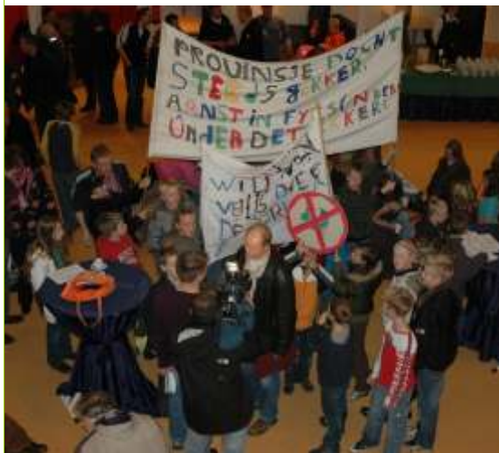
Ouders, kinderen en belanghebbenden voeren actie om te voorkomen dat fietsers en landbouwverkeer tegelijk over de brug bij Blauferlaet moeten.

Staten geven er verrassend de voorkeur aan om de weg een paar kilometer naar het westen te verplaatsen tussen Donkerbroek en Oosterwolde. De omwonenden hebben verzocht om uitstel, zodat ze met goed onderbouwde argumenten kunnen komen wat de consequentie is van het verhuizen van het tracé. Het CDA stemt daarmee in. Na de inspraakprocedures zal Provinciale Staten op 23 april 2008 een principebesluit nemen over het nieuwe voorkeurstracé.